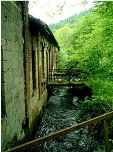
pulvermuehle2: Die Rückansicht der alten Anlage, gleich an einem kleinen Bach gelegen, der aber eine enorme Strömung aufwies.

Dem ganzen Erscheinungsbild nach muss auch diese Sprengstofffabrik schon Ewigkeiten verlassen sein und der Rentner hier sagte, dass die schon Anfang der 70iger Jahre dicht gemacht hätten und es habe immer Gerüchte gegeben, dass es in dem Anwesen spuken soll, was natürlich hanebüchener Unsinn ist, aber es gibt ja Leute, die für solches Gedankengut empfänglich sind. Der Rentner meinte, dieses nahezu lächerliche Gerücht würde gerne damit begründet, dass sich da die unruhigen Seelen der mit den dort hergestellten Produkten getöteten Personen melden würden, weil die auch ganz gefährliche Munition hergestellt hätten. Belegt sei hingegen, so der Rentner, dass in dem Gemäuer seit seiner Stilllegung insgesamt 3 Personen spurlos verschwunden wären. Man wisse angeblich nur definitiv, dass sie in das Gebäude gegangen wären, weil es dafür seinerzeit mehrere Augenzeugen gab, aber aufwändige Durchsuchungen nach dem gemeldeten Verschwinden, hätten von denen überhaupt keinerlei Anhaltspunkte mehr hervor gebracht. Naja, soll man da noch herausfiltern, was Märchen, Legende oder Tatsache ist, zumal der letzte Vorfall davon auch schon