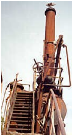
schrottplatz-anlage: eine eigenartige alte Anlage einschließlich eines Schornsteines, der einen Deckel oben drauf hat.

Leider herrschten zwischen den Bäumen äußerst ungünstige Lichtverhältnisse mit Teilgegenlicht, welches zwischen den Bäumen einfiel, was die Kamera dazu veranlasste, die Helligkeit automatisch zu weit zurück zu fahren, so dass das Foto qualitativ trotz schönsten Sonnenscheins an diesem Tag nicht viel taugt. Ich hatte den Eindruck, dass die meisten der Bäume in diesem Bereich krank sind, weil vor allem deren untere Hälften wie abgestorben wirkten. Vielleicht eine Auswirkung von Öl oder Benzin, welches in den Boden gelangt ist? Ebenso auf diesem Gelände entdeckten wir ziemlich am südöstlichen Rand des Grundstücks, wo der Waldhain selbst schon vorbei ist, eine eigenartige alte Anlage. Aus dem Boden kommen dort sehr dicke alte rostige Eisenrohre, diese führen in einen vielleicht 12 m großen, waagerechten Kessel, unter dem sich 8 riesengroße Gasbrenner befinden, die von rostigen Gitterkonstruktionen umgeben sind, damit man da wohl früher nicht reinfassen und sich die Finger verbrennen konnte. Daneben dann die auf dem Foto schrottplatz-anlage ersichtliche Anlage, mit der Eisentreppe und einem alten Eisenschornstein, der oben drauf einen Deckel hat mit dem man ihn wohl von unten per Hebelbetätigung verschließen konnte, wenn er nicht gebraucht wurde. Wozu das diente, weiß ich nicht, es ist ortsfest im Boden auf stabilen Betonfundamenten installiert, und ich hatte auch noch keine Gelegenheit den Eigentümer des Grundstücks danach zu fragen.