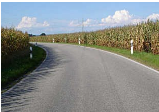
zufahrtsstrasse: die Straße zu unserer Siedlung, relativ weit oben, noch unweit der Abzweigung von der Bundesstraße. Bremsspuren in der Mitte zeigen, wo der Unfall war.