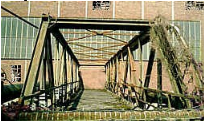
sinnlose-bruecke: eine Brücke, die direkt an der Außwand der Fabrikhalle endet, überquert einen der alten, flußartigen Abwasserkanäle in diesem Bereich.

Die damaligen Fotos waren winterbedingt ja eher etwas kahl. Ebenfalls um eine Brücke, aber ganz anderer Art, geht es im nächsten Foto sinnlose-bruecke. Damals schickte ich Ihnen auch mal ein Foto von großen offenen Abwasserkanälen, die weit südwestlich flussartig auf dem Areal der Fabrik zwischen einigen alten Hallen verlaufen. Damals war es ungemütliches Wetter und unsere Erkundungen in diesem Bereich nur flüchtig und unkomplett. Jetzt waren wir noch mal dort und entdeckten dabei eine absolut sinnlose Brücke, die über einen dieser Abwasserkanäle bis fest an die Außenmauer einer größeren Halle führt. Dort ist aber nichts, außer Mauerwerk. Was das soll, mag sich keinem erschließen, eigentlich kann es nur so gewesen sein, dass früher mal in der Hallenmauer an dieser Stelle ein Tor oder ein Durchbruch war, denn alles andere macht doch keinen Sinn. Man sieht auch in den Klinkersteinen in der Hallenmauer in diesem Bereich 2 Abfang - Stahlträger, die in den anderen Seitenfeldern nicht sind, daher wird dort wohl früher ein Tor gewesen sein. Die große Halle hinter der sinnlosen Brücke ist im Vergleich zu den anderen Hallen in diesem südwestlichen Bereich, noch sehr gut erhalten und sie zählt zu den wenigen Gebäuden, die wir bisher noch nicht von innen gesehen haben, weil sie sehr gut verschlossen ist.