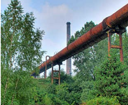
rohrbruecke-hinten: ein interessanter Kontrast, die alten Industriereste und die grüne Vegetation