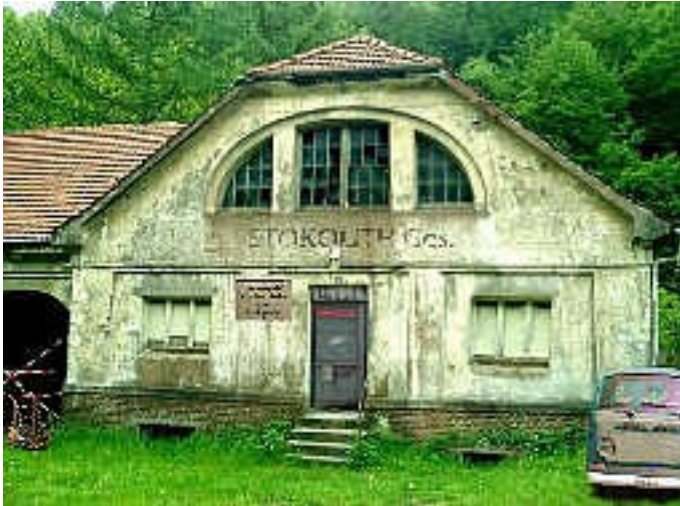
pulvermuehle1: Teil - Frontansicht der alten Pulvermühle bzw. Sprengstoff- und Munitionsfabrik Dr. Stocklossa, insbesondere die Verwaltung und ein Labor dürften in diesem rechten Gebäudeteil gewesen sein. Die eigentliche, kleine Fabrikhalle folgt links.