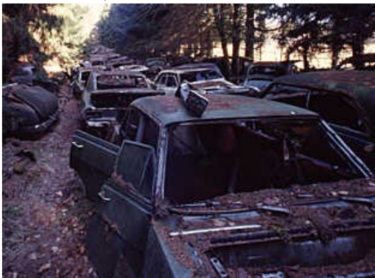
schrottavenue: wie während eines Staus, der nie sich nie auflöste, auf der Straße eingerostet stehen Autos, deren Baujahr vorwiegend zwischen 1950 und 1970 gelegen haben dürfte.

Es stehen auf ähnliche Weise noch weitere Gebäude oder besser gesagt Gebäudereste in diesem teils verwilderten Bereich, die man aber nur schwer entdecken kann, weil es dort keine Wege mehr gibt, die nicht ebenfalls schon total zugewachsen sind. Genauso ging es mit dem Foto schrottavenue. Es zeigt einen Waldweg weit hinten in diesem Waldhain, der auf einer Länge von etwa 400 m regelrecht mit zivilen Schrottautos aus den 50iger und 60iger Jahren zugeparkt ist. Die stehen dort zwei- und dreireihig sowie stellenweise auch noch quer zwischen den Bäumen. Es wirkt fast so, als stünden die Fahrzeuge in einem Stau. Überspitzt könnte man sagen, ein Stau, der sich nie mehr aufgelöst hat und andauerte, bis dass die Autos verrostet und zerfallen waren.