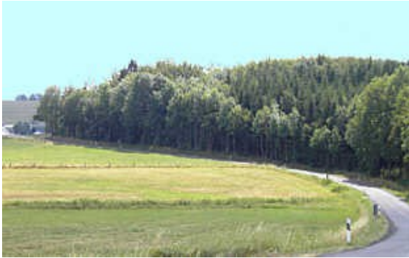
Landstraße6: eine idyllische kleine Straße, die sich zwischen den einzelnen Waldhain-Gruppen von Dorf zu Dorf schlängelt.

Weihers vielleicht in einem knappen Kilometer Entfernung auf eine hübsche kleine Landstraße, die Sie auf dem Foto Landstraße6 sehen. Es wurde jedoch relativ schnell sehr schwül an dem Tag und Kayla meinte, dass sich offensichtlich heftige Gewitter zusammenbrauen würden.