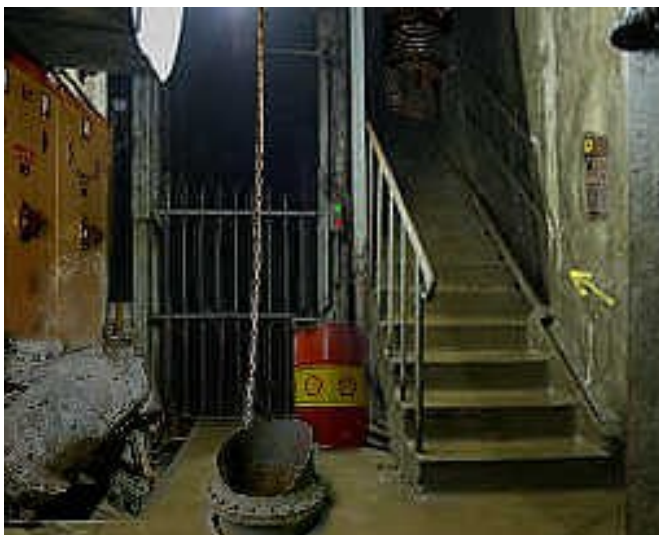
Fabrik-keller062: eine Treppe nach oben und ein Schacht nach unten

Viele Erkundungen standen jüngst wieder auf dem Programm. Vor einiger Zeit hatte ich Ihnen, u.a. mit Fotos von den alten unterirdischen Gängen mal berichtet, die von unserem Hauskeller abgehen. Damals hatten wir uns ab einer bestimmten Stelle nicht mehr weiter getraut. Sie ahnen sicher, dass uns das auf längere Sicht jedoch keine Ruhe gelassen hat. Nach dem ersten langen Kellergang, der ja noch auf unsere Kosten beleuchtbar ist, folgt eine Abzweigung, der wir damals nach rechts folgten. Dieses mal haben wir die linke Abzweigung gewählt, obwohl dort schon nach wenigen Metern Wasser auf dem Fußboden stand. Der Weg hat sich gelohnt, denn nach ein paar Metern endete das Wasser vorwiegend und es ging größtenteils trocken weiter. Nach vielleicht geschätzten 50 bis 70 Metern folgte eine rostige Eisentür, die wir öffneten und die sich auch erstaunlich leicht öffnen ließ. Da staunten wir wirklich nicht übel, dahinter verbarg sich das, was Sie auf dem Bild fabrik-keller062 sehen.