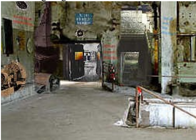
Fabrik-innen628: eine Halle, in der wir bislang noch nie waren. Rechts kommt die Treppe aus dem Keller hoch, die Sie auch auf dem obigen Foto von unten sehen.

Beim weiteren Herumschlendern in diesem Hallenteil fanden wir dann schnell heraus, dass wir uns in einem seitlichen Anbau der Haupthalle befanden. Einige Räume weiter stießen wir auf eine Art ehemalige Werkstatt, wo wohl früher mal irgendwelche Teile an langen Werkbänken repariert wurden. Recht rostig geht es dort heute zu und es wirkt so, als hätten die Arbeiter vor rund 20 Jahren dort alles fallen gelassen und wären nachhause gegangen. Dort liegen auf zahlreichen Werkbänken noch etliche Apparate oder Maschinenteile aus dickem Eisenguss, an denen wohl noch bis zum letzten Tag gearbeitet wurde.