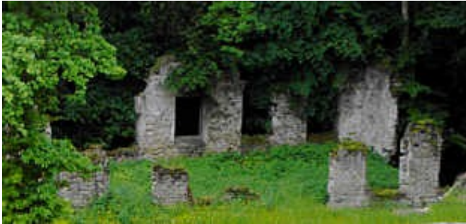
Mauerwerksreste3: Ruine eines sehr alten Gemäuers, vermutlich einer ehemaligen Kirche

Auch die Landschaft in unserer näheren Umgebung haben wir in den letzten Wochen wieder verstärkt erkundet. U.a. waren wir wieder an der weit westlich liegenden verfallenen Villa vorbei gewandert und dann von dort aus weiter in südliche Richtung abgebogen, wo wir bislang noch nie waren. Wie für diese Landschaft typisch, folgen immer wieder kleine Waldhain - Abschnitte, die von meist etwas längeren, leicht hügeligen Feld- und Wiesenflächen unterbrochen werden. Im nach der Villa folgenden zweiten Waldhain entdeckten wir dann erneut Überreste eines alten Gemäuers. Das sehen Sie auf dem Foto mauerwerksreste3.